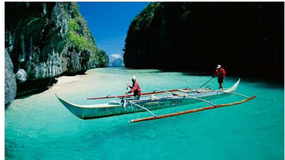
Imagen El Nido