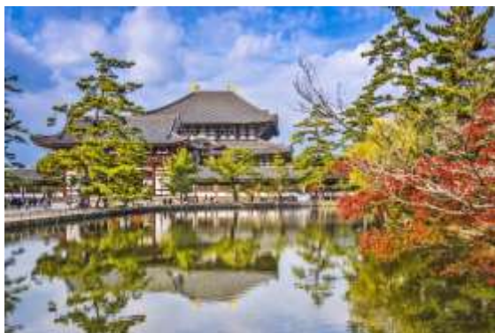
Imagen de Nara